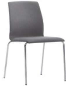
Four legs chair Silla 4 patas Chaise 4 pieds

La colección – The collection – La collection