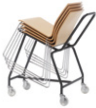
Dolly Carro Chariot