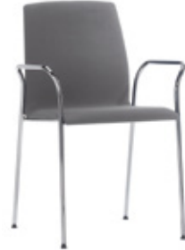
Four legs stackable armchair Sillón cuatro patas apilable Fauteuil quatre pieds empilable