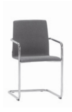
Cantilever armchair Sillón pie patín Fauteuil pied luge