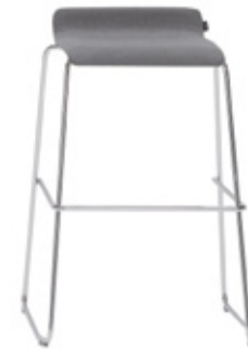
Low sled stool Taburete bajo pie varilla Tabouret bas pied tige d'acier