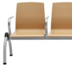
Arm for bench Brazos para bancada Accoudoirs pour poutre