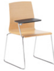
Writing tablet Tabla de escritura Tablette d'écriture