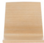
Wooden monoshell Carcasa de madera Coque bois