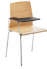
Oversized writing tablet Tabla de escritura XL Tablette d'écriture XL