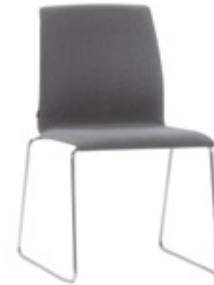
Rod sled chair Silla pie varilla Chaise avec pietement en tige d'acier