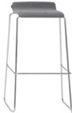
High sled stool Taburete alto pie varilla Tabouret haut pied tige d'acier