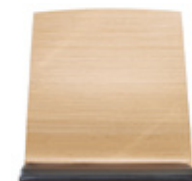
Wooden monoshell with upholstered seat Carcasa de madera con asiento tapizado Coque bois avec assise tapissée