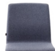
Fully upholstered monoshell Carcasa tapizada Coque tapissée

*The designs of this collection are protected by international industrial design registries.