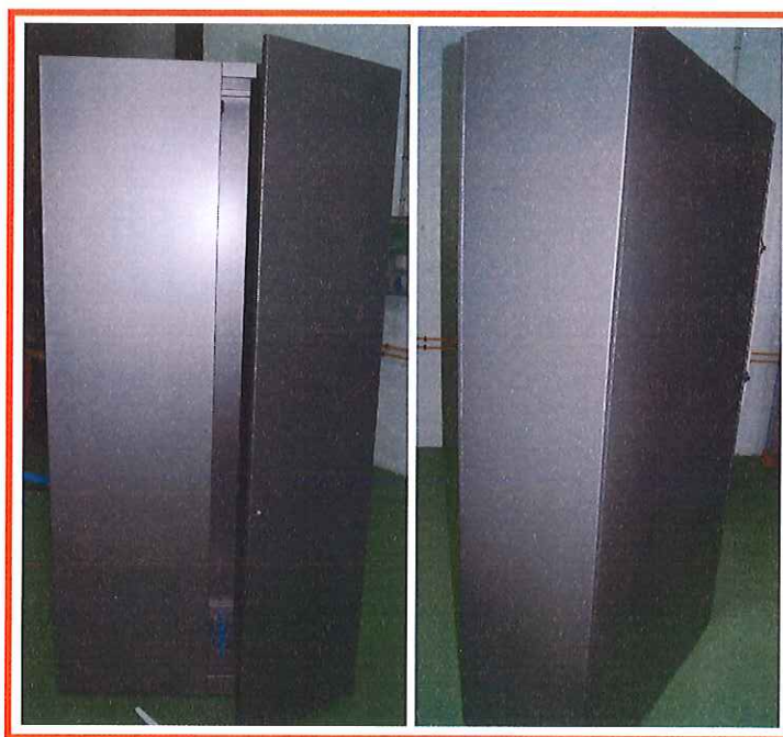
Detalle de la muestra